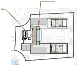
Planting: Rooftop Scale: 1:50